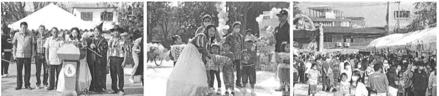
มอบขนมนงานวันเด็กแห่งชาติ ๒๕๖๖ ณ โรงเรียนอนุบาลสุริยาอุทัยพิมาย อำเภอพิมาย จังหวัดนครราชสีมา