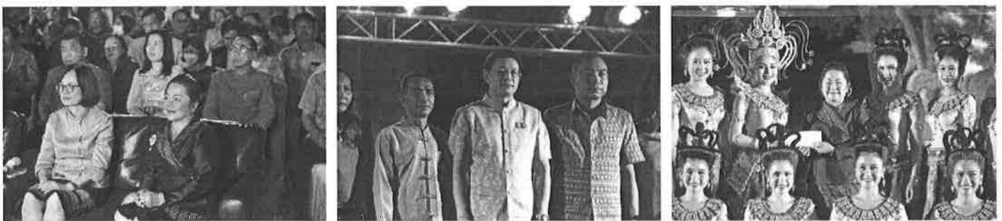
พิธีเปิดงานการแข่งขันผัดหมี่ ส้มตำ ในงานเทศกาลเที่ยวพิมาย ประจำปี ๒๕๖๖ ณ ลานหน้าที่ว่าราชการอำเภอพิมาย อำเภอพิมาย จังหวัดนครราชสีมา

พิธีเปิดงานเทศกาลเที่ยวพิมาย ประจำปี ๒๕๖๖ ณ อุทยานประวัติศาสตร์พิมาย อำเภอพิมาย จังหวัดนครราชสีมา