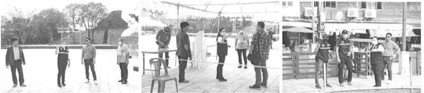
จัดสถานที่เตรียมงานวันเด็กแห่งชาติ ณ ลานพรหมทัต อำเภอพิมาย จังหวัดนครราชสีมา

โครงการจัดงานวันเด็กแห่งชาติ ประจำปี ๒๕๖๖ ลงพื้นที่จัดสถานที่งานวันเด็กแห่งชาติ ณ ลานพรหมทัต อำเภอพิมาย จังหวัดนครราชสีมา