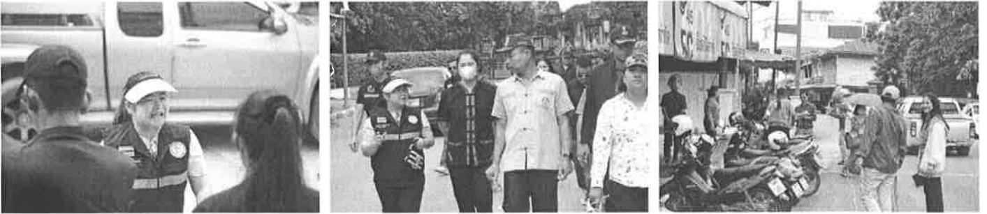
พิธีบวงสรวงปราสาทหินพิมาย เนื่องในวันงานเทศกาลเที่ยวพิมาย ประจำปี ๒๕๖๖

ลงพื้นที่วางแผนเตรียมงานเทศกาลเที่ยวพิมาย นครราชสีมา ประจำปี ๒๕๖๖ ณ ลานพรมหัตต์ ตำบลในเมือง อำเภอพิมาย จังหวัดนครราชสีมา