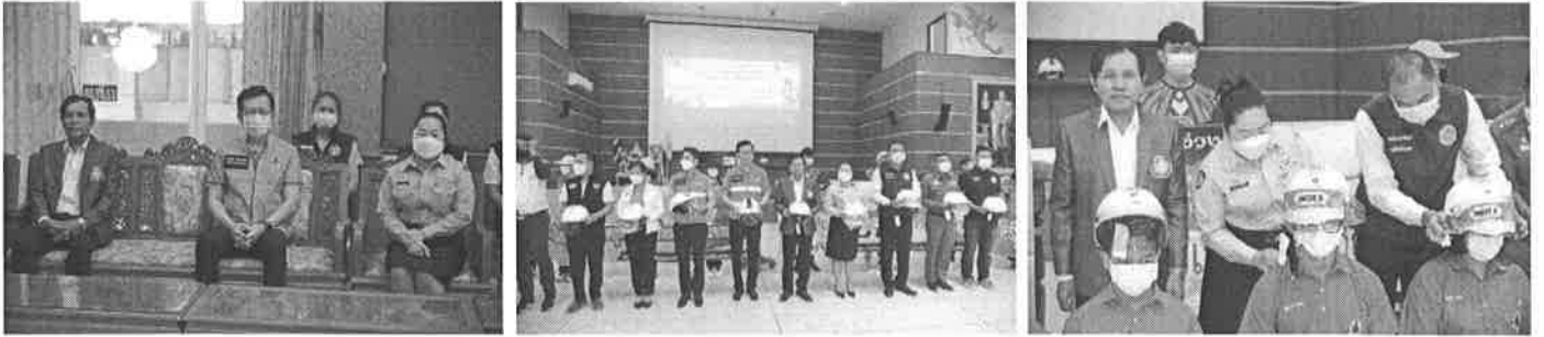
เดินรณรงค์ใส่หมวกนิรภัย ปลอดภัย ๑๐๐ เปอร์เซ็นต์

โครงการรณรงค์การสวมหมวกนิรภัย ๑๐๐ เปอร์เซ็นต์ ประจำปี ๒๕๖๖ โดยบูรณาการร่วมกับกิจกรรมรณรงค์ความปลอดภัยทางถนน จังหวัดนครราชสีมา