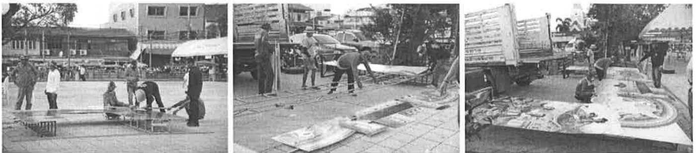
จัดกิจกรรมวันเด็กแห่งชาติ ประจำปี ๒๕๖๖ ณ ลานพรหมทัต อำเภอพิมาย จังหวัดนครราชสีมา โดยได้รับความร่วมมือระหว่างหน่วยงานภาครัฐ ภาคเอกชน พ่อค้า คหบดี